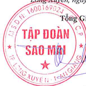
TRƯƠNG VĨNH THÀNH